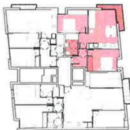
HABITATGE 4 o 2 a