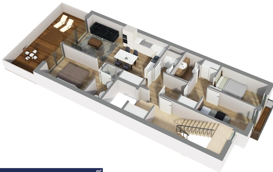
Imagen simulada del proyecto real. Esta imagen no tienen valor contractual y podrá experimentar variaciones por exigencias técnicas, legales, administrativas o a iniciativa de los arquitectos directores de las obras, sin que ello implique menoscabo del nivel de calidades. Todo el mobiliario es meramente decorativo, no formando parte del proyecto ni de la memoria de calidades.